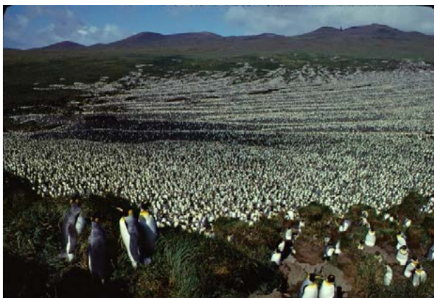
Vue générale de la colonie de manchots royaux de l'île aux Cochons en 1982.

Réserve Naturelle TERRES AUSTRALES FRANÇAISES