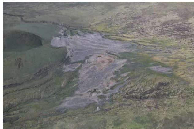
Vue de la colonie prise du nord depuis un hélicoptère le 30 décembre 2016.