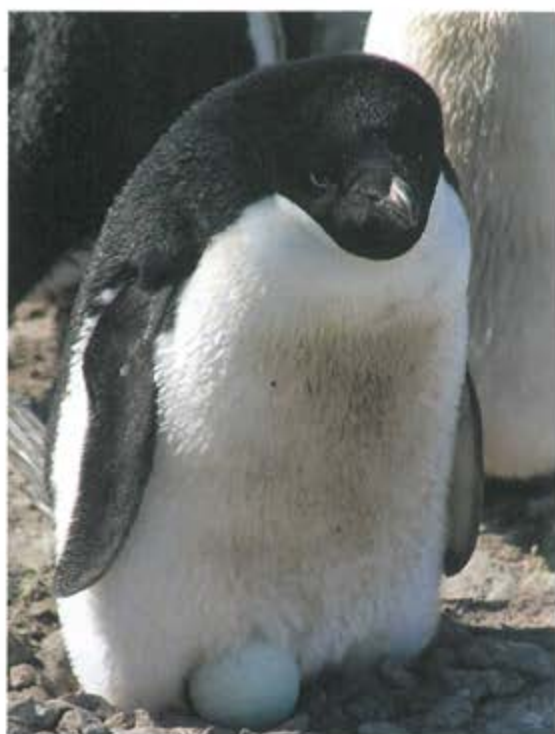
Manchot Adélie sur son nid.