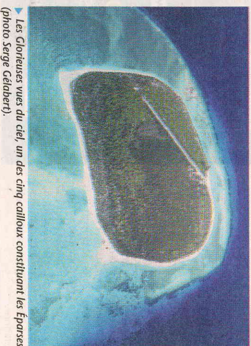
► Les Glorieuses vues du ciel, un des cinq cailloux constituant les Éparses.