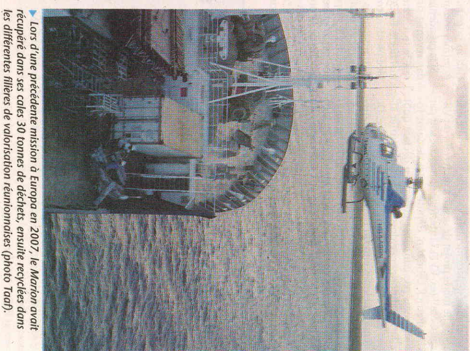
► Lors d'une précédente mission à Europa en 2007, le Marion avait récupéré dans ses cales 30 tonnes de déchets, ensuite recyclés dans les différentes filières de valorisation réunionnaises.