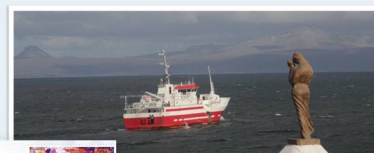
Le « Saint-André » au mouillage dans le golfe du Morbihan à Kerguelen

Le palangrier-surgélateur « le Saint-André » a fait escale à Port aux Français le 2 avril 2012. L'occasion pour les marins du bord de se "dégourdir" les jambes et de mettre le pied à terre après plusieurs mois de mer. Un pli a été réalisé à cette occasion.