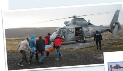
Le blessé est évacué par l'hélicoptère de type Panther de la FS « Floréal »

La formidable mobilisation des équipes de la base et des marins aura permis un dénouement heureux.