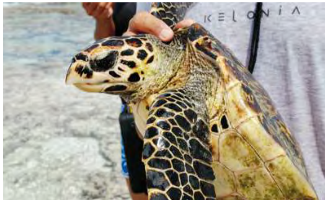
Autre espèce emblématique des Éparses, la tortue imbriquée se distingue par son bec et sa carapace dentée.

ÉPARSES. Non, ce n'est pas le dernier sport extrême à la mode. Si attraper les tortues dans le lagon de Juan de Nova a tout d'une discipline olympique en puissance, c'est avant tout un travail essentiel au suivi et à l'étude de cette espèce protégée. Vertes ou imbriquées, les tortues des Éparses recèlent encore nombre de mystères que des scientifiques réunionnais tentent de percer.