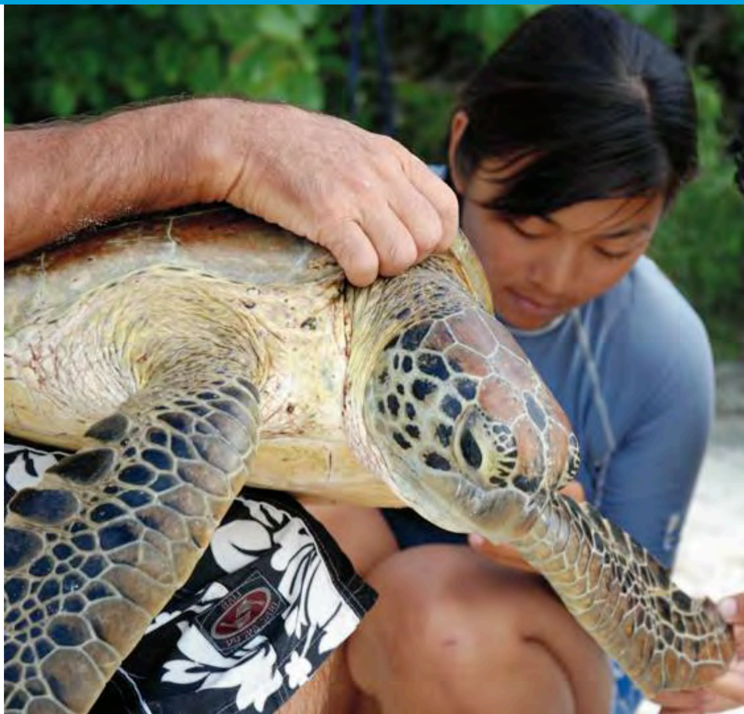
Les scientifiques procèdent à un prélèvement biologique sur cette tortue verte qui vient d'être baguée.