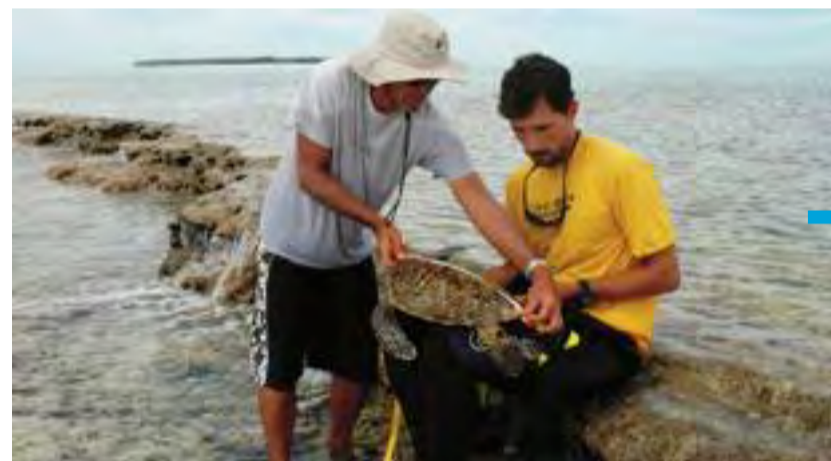
À chaque capture, la tortue est mesurée, pesée, photographiée, baguée avant d'être relâchée dans le lagon.